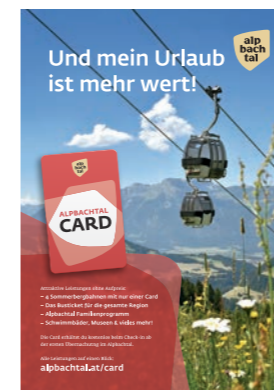
1 Seite Inserat oder PR